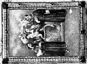
Maria SS. della Consolazione